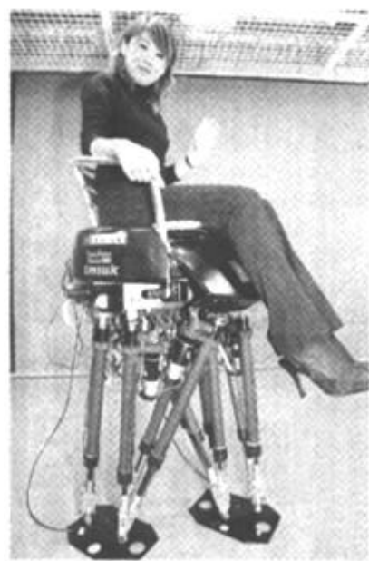
11月21日,一个坐椅式机器人在东京的一个实验室载着模特行走。

加沙地带的部分犹太人定居点,并准备将一些定居点合并,以便为未来巴勒斯坦建国腾出一定空间,同时减轻以军的防卫负担。