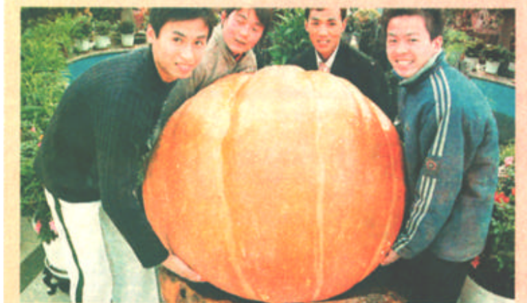
11月20日，几个年轻人在试抬巨型南瓜。日前，一个重达592斤的巨型南瓜在黑龙江山省哈尔滨市亮相，吸引了不少市民前来一饱眼福。这个巨型南瓜是由菜生产基地培育出来的，周长3.6米，直径1.2米。 哈尔滨兴安生态园酒店无公害蔬