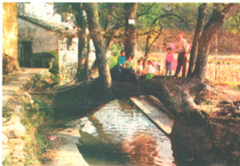
11月19日，婺源县镇头镇冷亭村的孩子们在“树桥”上。江西500岁古樟 舍身“卧河”作“树桥” 米天然“树桥”奇观，村民们可近旁小河对岸横卧，形成一座长4米由此过河。