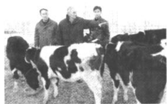
11月21日,著名受精生物学家陈大元(中)等三位专家正在介绍成纤维体细胞克隆牛。新疆金牛生物股份有限公司成纤维体细胞克隆牛研究与生产项目于当日正式通过科技成果鉴定。