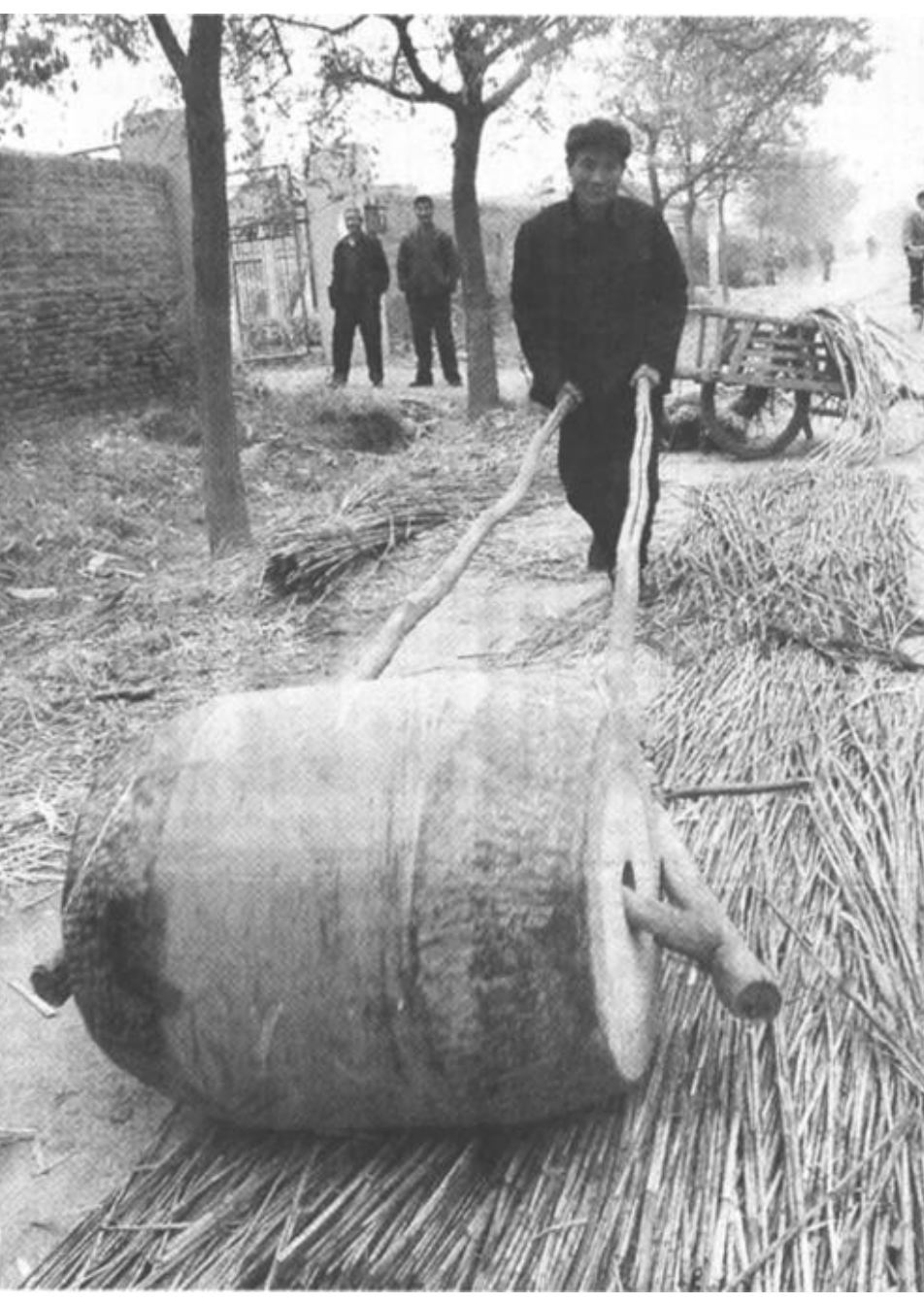
农闲到来，广饶县大码头乡二村的乡亲们利用闲暇时间，又开始了自己的传统手工艺制作——苇席编织。虽说近几年来由于费时、费力、市场萎缩等原因，从事苇席编织的人越来越少，但作为一种传统的生活用品，苇席仍然有着自己强大的生命力和存在空间。 图为村民谷陈正在碾压收割来的芦苇。

日前，我市干警经过周密部署，一举抓获了致人重伤后潜逃的犯罪嫌疑人“老黑”，为社会安定消除了一个“毒瘤”。 案发于市庆前夕 经审理查明，9月8日晚上，“老黑”喝了酒后，来到商贸城一家理发店内，与两名女服务员发生了口角，争执中，“老黑”拿起一瓶洗发膏打到了其中一名服务员的脸上，该女子则叫来其丈夫罗某为自己出气。罗某和“老黑”见了面，两人越说越僵，最后动了手，“老黑”一刀捅到了罗某的左大腿上…… 罗某被送到了医院急救，经检查发现，罗某的左腿神经被捅断，最终导致罗某被截肢。“老黑”一见事情不妙，连夜潜逃了。时值建市20周年前夕，这件重伤案引起了社会各界的关注，市局领导非常重视，破案干警们也感到了沉沉的责任感。 细致排查现踪 虽然“老黑”的真实身份无人了解，但干警们经过认真排查，还是很快调查清楚了“老黑”的有关情况和体貌特征，并了解到，“老黑”于当晚从曹州路向南逃跑了。经过认真摸排，“老黑”的踪迹在潍坊被发现，市公安局于是请求潍坊警方协助抓捕。20日，潍坊警方返回消息，他们已掌握了“老黑”的行踪。但“老黑”似乎听到了什么消息，从一个朋友那里借了点钱又跑到了临沂，并隐瞒身份，应聘到一家保健品公司当了司机。 周密部署抓获逃犯 在掌握了“老黑”的确切行踪后，9月30日，干警们赶到“老黑”的公司附近进行布控。不久，一辆送货车开到了公司门口，从车上下来两个人进了公司，干警们经过仔细辨认，确认其中一人正是“老黑”，便在公司外面耐心等待。十几分钟后，“老黑”从公司里出来，到附近的一家网吧内上网。干警们一边监控，一边同临沂刑警联系，双方一举将“老黑”擒获。经过突审，“老黑”交待了自己的真实身份，并对犯罪事实供认不讳。第二天，“老黑”被押回了东营。 (召伟 兆鹏 国宏)