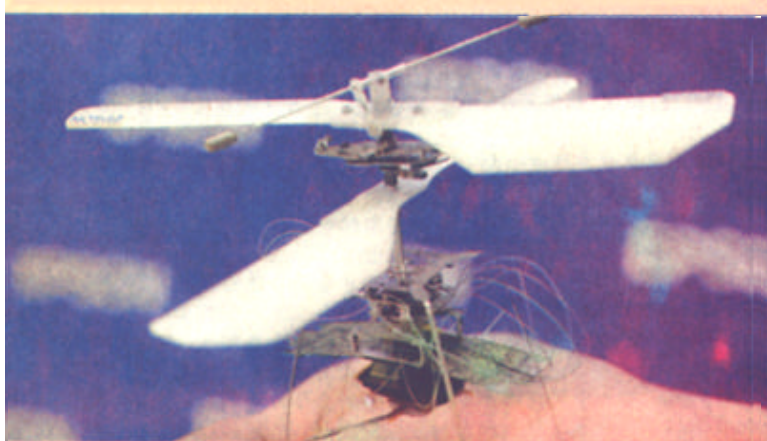
11月19日，在东京“2003国际机器人展”上，日本精工爱普生公司展示一个微型飞行机器人。这种微型飞行机器人重量只有8.9克，室内飞行高度为1米。它由两个螺旋桨带动，可自行控制飞行姿势，前后左右移动自如。螺旋桨直径约为13厘米，两个螺旋桨分别朝相反的方向转动，可产生13克的升力。该公司声称，这种微型飞行机器人能在空间狭窄的救灾现场一显身手。