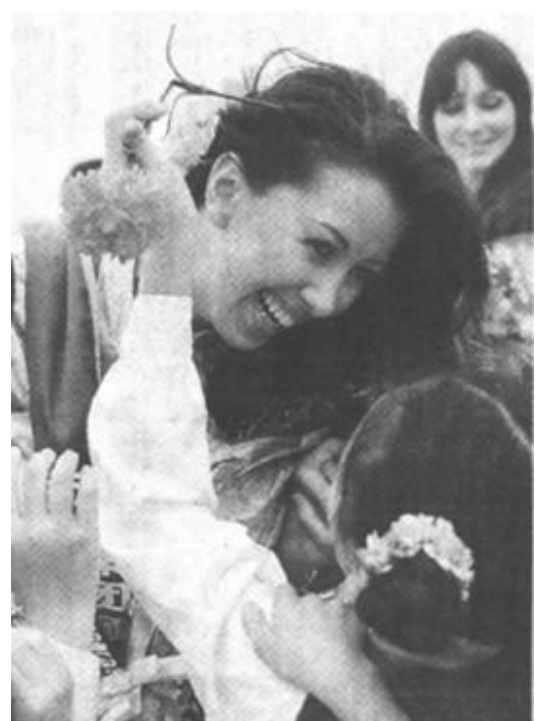
当日,参加第53届世界小姐总决赛的110名佳丽抵达海口美兰机场。她们将在海南岛进行一些公益活动,然后进行封闭训练。

通知要求,要在巩固治理整顿成果基础上,进一步完善土地管理各项制度,着重从体制、机制和法制上解决问题。要深化征地制度改革,健全完善土地有偿使用制度和土地产权制度。